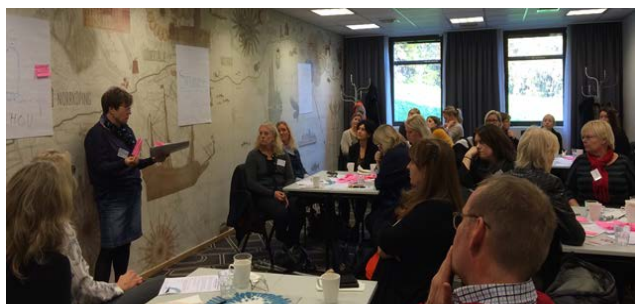
Den 26 oktober pågick intensiva diskussioner på Workshopen "unga vuxna som varken arbetar eller studerar"

Totalt har 49 personer deltagit i insatsen analys och Kartlägningsinsatser.