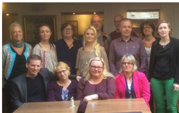
Förbundschefen och Östra Nätverket för Samordningsförbund

Under året har Vaxholm och Danderyds kommun träffat Förbundschefen och visat intresse att ingå i förbundet.