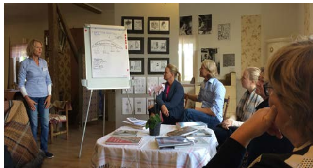
Styrelsens studiebesök 150909 med delar av Beredningsgruppen