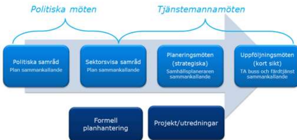
Bild 1: Befintliga samverkansforum mellan kommuner och Trafikförvaltning/nämnd