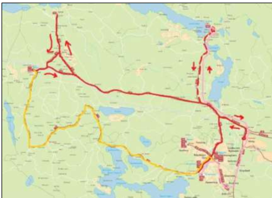
Figur 2. Dagens linjenät. Dagens linje 782 visas i röd färg, dagens 782X i rosa och linje 779 i gul färg.

Dagens linjenät inom kommunen är svårt att förstå och linjesträckningarna har flera så kallade skaftkörningar, där resenärer reser fram och tillbaka samma väg. Se dagens linjenät i Figur 2 nedan.