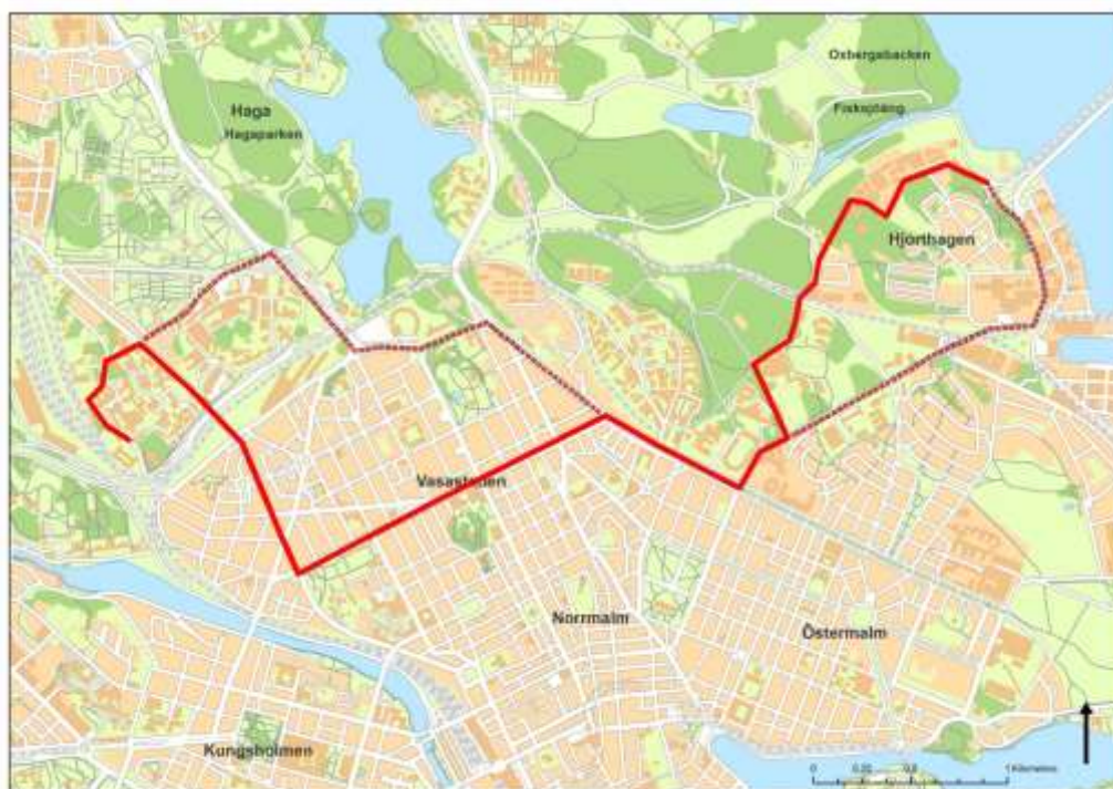
Figur 5. Ny linjesträckning för linje 73.