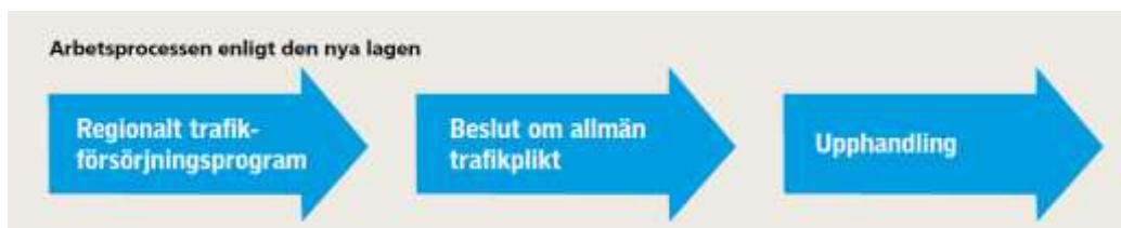
Figur 1. Beslut om allmän trafikplikt, det vill säga vilken kollektivtrafik som samhället ska avtala om, baseras på det regionala trafikförsörjningsprogrammet. Efter beslut om allmän trafikplikt sker upphandling av trafiken.

Utifrån de fastställda målen i trafikförsörjningsprogrammet tas beslut om vilka linjer som ska ingå i den allmänna trafikplikten. Efter detta beslut sker upphandling av trafik (se processen i Figur 1 nedan).